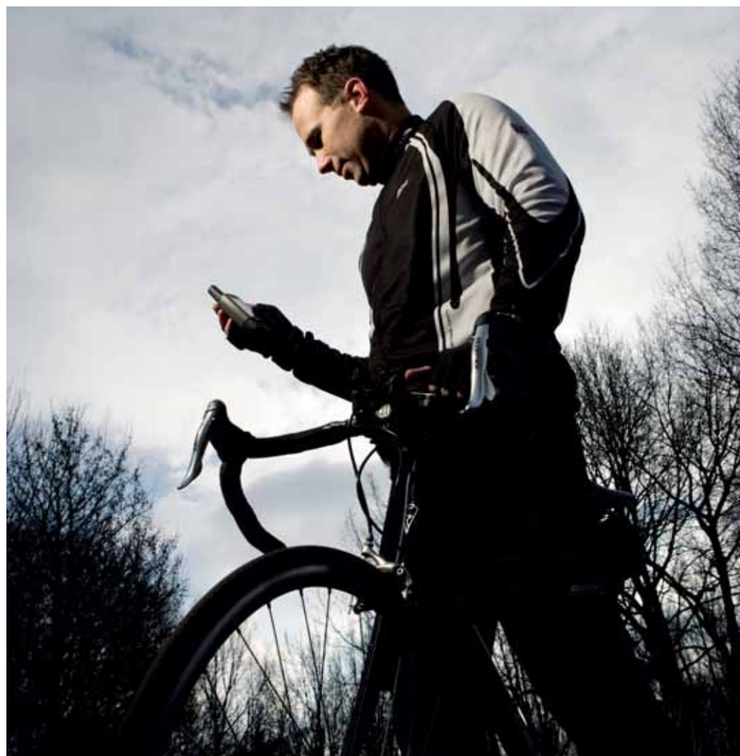
'Ik kocht naast drie nieuwe fietsen ook een fiets-gps van 400 euro, die er tegen kan als ik over de kop ga'

'Sinds afgelopen jaar verdien ik netto ruim 200 euro meer per maand. Ik heb daar niet zelf om gevraagd, dat is niks voor mij. Ik vind het echt de taak van de